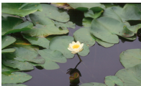
Nymphaea alba uma planta característica deste habitat Ribatejo, Infantado (C.P.Gomes)