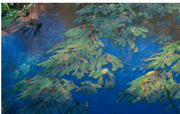
Aspecto da comunidade dominada por Potamogeton nodosus Algarve, Fonte Benémola (C.P.Gomes)